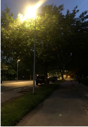
Her er belysningen i konflikt med træbevoksningen