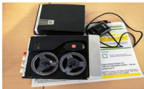
Spolebåndoptager i miniformat var blandt de 30 ting, der blev indleveret