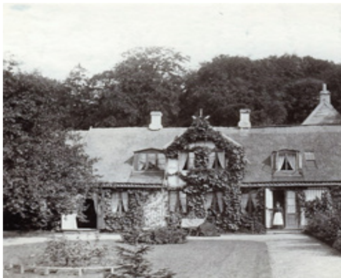
Fuglsang. 1899

Har du lyst til at være med i et fællesskab?