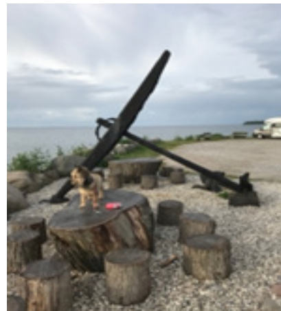
Sådan nogle træner vi også på til agility

Der er så dejligt ved vandet, og jeg elskede når mor tog mig med på en lang morgentur ved 6 tiden, somme tider gik vi en hel time. Fremmede dufte, mange hilsener fra nye hundevenner og fantastisk natur over det hele. Tak for turen mor, jeg er begyndt at spare op til næste gang, jeg får lov at komme med på ferie.