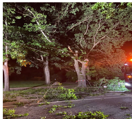
Træfældningen i gang på Frederiksdalsvej