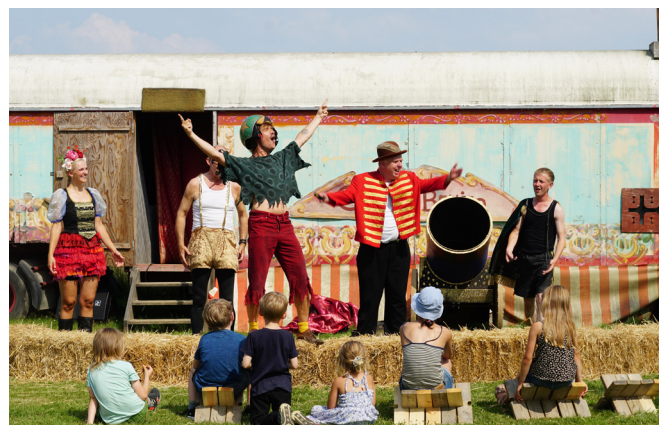
Orla Frøsnapper på Frilandsmuseet

da der er et begrænset antal pladser per gang. FRØSNAPPERFESTIVAL 11.07 - 1.08 Orla Frøsnapper, Lille Virgil, Gummi-Tarzan, Topper, Otto og alle de andre rødder fra Ole Lund Kirkegaards klassiske børnebøger vender stærkt tilbage, når de indtager Frilandsmuseets stationsby i sommerferien – og du kan være med. Til Frøsnapperfestival træder du ind i et finurligt 70'er univers, hvor du kan møde karaktererne og se deres sjove historier udfolde sig som familievenlige teaterstykker imellem huse, haver og på gamle sporvogne i stationsbyen. Her bliver der farvet batik, bygget med byggebrædder, leget dåseskjul og malet frække ord