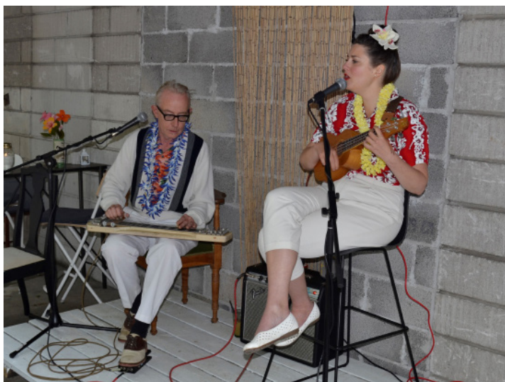
Duo Tones spillede

Hold øje med programmet, der er masser af spændende aktiviteter i løbet af sommeren hos Villa Vi.