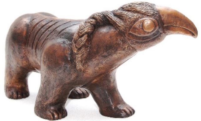
Bjørnekvinde i bronze