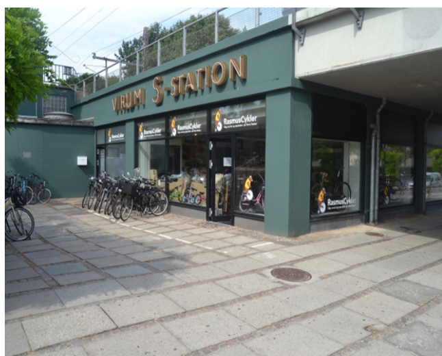
Virum Station passedede godt i serien, som foregår i 1970'erne