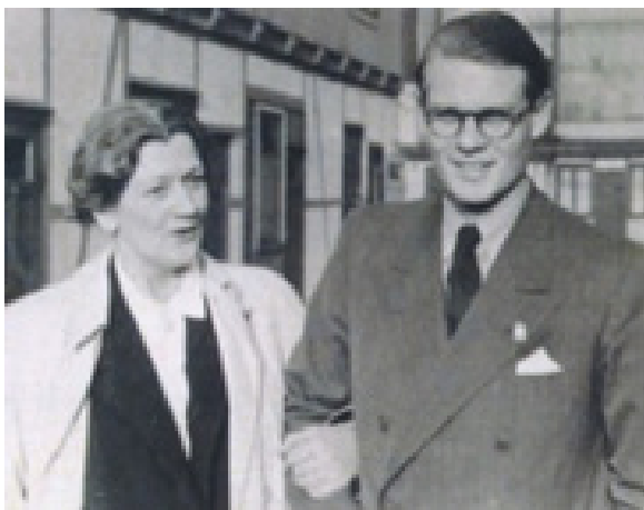
Bodil Ipsen arm i arm med en ung Bagger