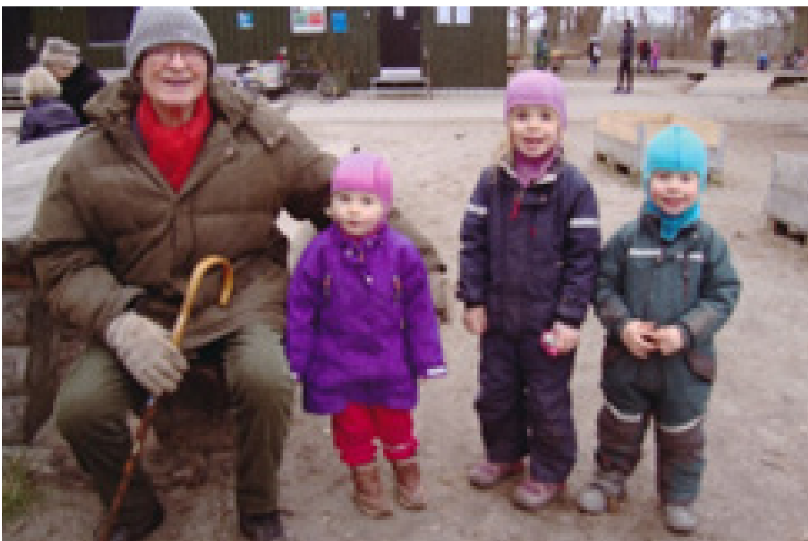
Bagger med tre af sine fem oldebørn

Lise var Baggeres nu afdøde hustru, som han heldigvis nåede at fejre diamantbryllup med.