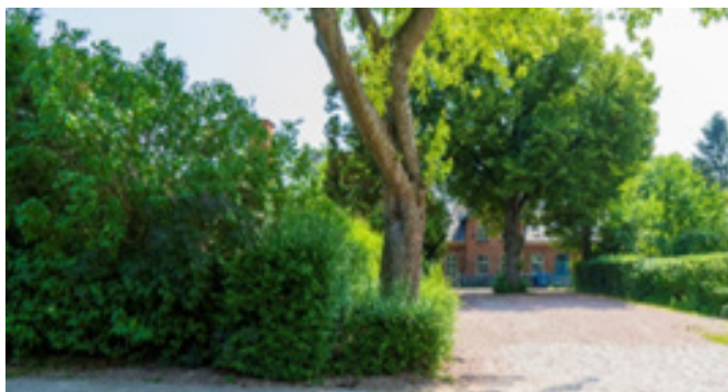
Børnehuset Humlehuset. Hummeltoften. 33. Juli 2021

I sidste nr. 10. 1. juni 2022 blev en del af artiklen om Klopstockegen eller Monrads Eg på Prinssestien desværre udeladt. På redaktions vegne undskyld. Så her får I resten med ønsket om en god juli, hvor avisen sommerferie, så vi ses igen til 1. august