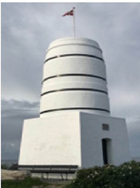
Flinteovnen i Rødvig Havn