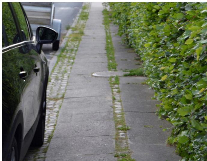
Er det hæk eller bil, der er ulovlig?

De nye regler må klart skulle gentænkes hos forvaltningen, så det ikke blot bliver en ekstraskat til bilejerne, som i forvejen er hårdt ramt i øjeblikket af stigende benzinpriser