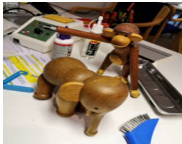
Kay Bojesen elefanten trængte til lidt lim

- Efterfølgende så vi, den manglede en stødtand - ejeren kommer nok tilbage ved næste café med lidt træ, så vil vi snitte en ny tand, det er vi jo verdensmestre i. Den anden abe havde tabt armene, men kunne ikke klares, da ejeren ikke havde fået købt et reparationskit. Vi ses til august, fortæl endelig alle, I kender, om vores projekt. Rigtig god sommer.