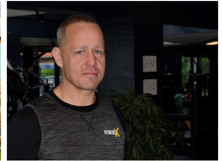
Ny Club Manager hos Fitness X Vi besøgte den nye manager Læs side: 6