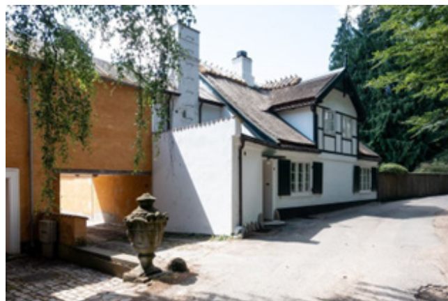
Fuglsang. Juli 2021