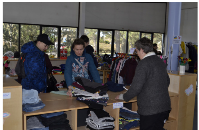
Der er altid meget travlt i Ukrainebutikken på Sorgenfri Torv. Der er derfor altid brug for frivillige hænder.

Der er fortsat stort behov for donationer til butikken. Du kan læse mere om donationerne på Virumpigerne for ukraines hjemmeside.