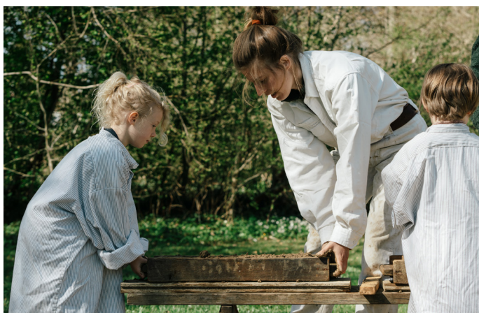
Deltag aktivt i museets aktiviteter

Rundt omkring på museet kan man gå på opdagelse i en model af museets gigantiske haubarg eller komme med indenfor i fremtidens bæredygtige børneværelse på kun 6 m2. Der skal også bages brød efter gamle opskrifter, plantefarves uld til filtbolde og bygges med byggebrædder ved museets svenske gårde.