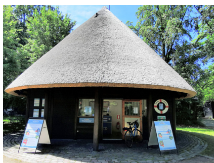
Billethuset ved Sorgenfrivej i Lyngby