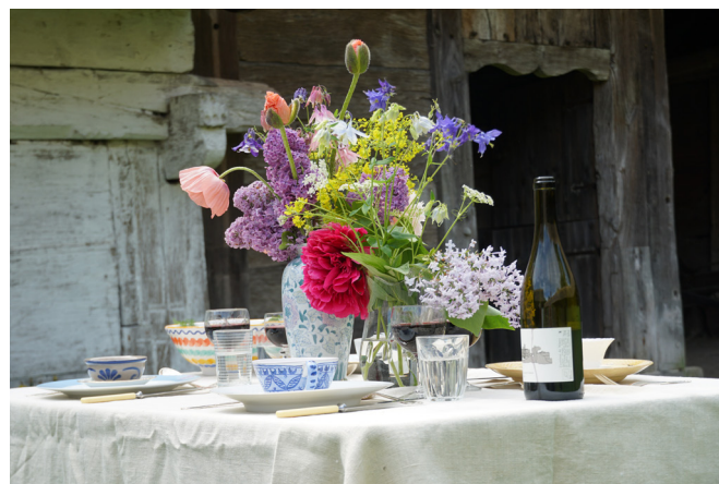
Fællesspisning - populært på Frilandsmuseet

OBS! Sidste år var fællesspisning udsolgt og der har allerede været stor efterspørgsel efter begivenheden, så vi anbefaler at købe billetterne i god tid,