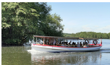
"Dana" på vej tilbage fra Bagsværd Sø.