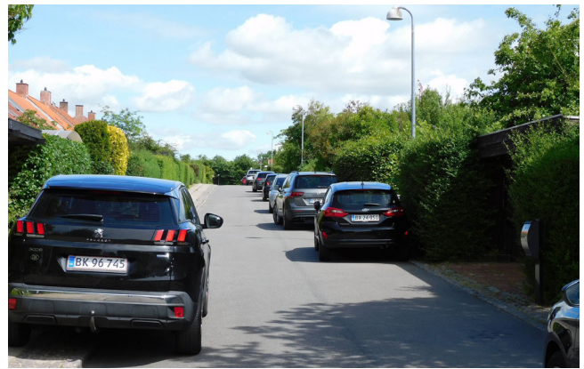
Ikke meget plads til parkering efter de nye regler

Afslutningsvis vil jeg spørge om, hvad man fra kommunens side har gjort for at oplyse kommunens borgere om den nye bekendtgørelse, som trådte i kraft den 31. marts i år, og hvis bestemmelser er kommet bag på de fleste beboere. Hvis det er Lyngby-Taarbæk Kommune så magtpåliggende, at parkering fremover skal foretages i overensstemmelse med de nye regler, kunne man så ikke indledningsvis fra kommunens side have iværksat en oplysningskampagne (SMS