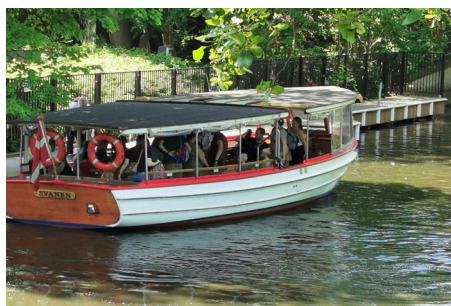
"Svanen" er tilbage fra Frederiksdal.