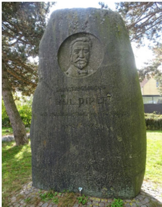
Emil Pipers mindesten.

Det var i høj grad Emil Piper, der gjorde forarbejdet til stiftelsen af Det Konservative Folkeparti i 1915. Emil Piper var efterfølgende formand for partiet til sin død i 1928. Han var med i mange politiske forsamlinger. Emil Piper var rigsdags- og folketingsmand. I Rigsdagen fra 1898 for partiet Højre, og fra 1906 sad han i Landstinget. Han var formand for Højres landstingsgruppe fra 1908 og sad i Københavns Amtsråd 1892-1922. Emil Piper var en betydningsfuld politisk skikkelse i perioden, hvor det moderne parlamentariske folkestyre fandt sin form.