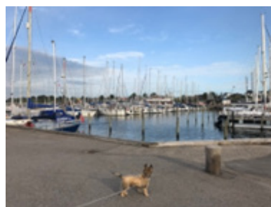
Jeg elsker morgenturen ved havnen kl. 6