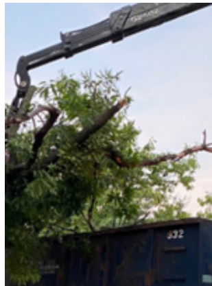
Al oprydning blev klaret i løbet af aftenen og natten