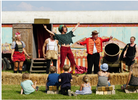
Masser af liv på Frilandsmuseet i ferien - læs side 25