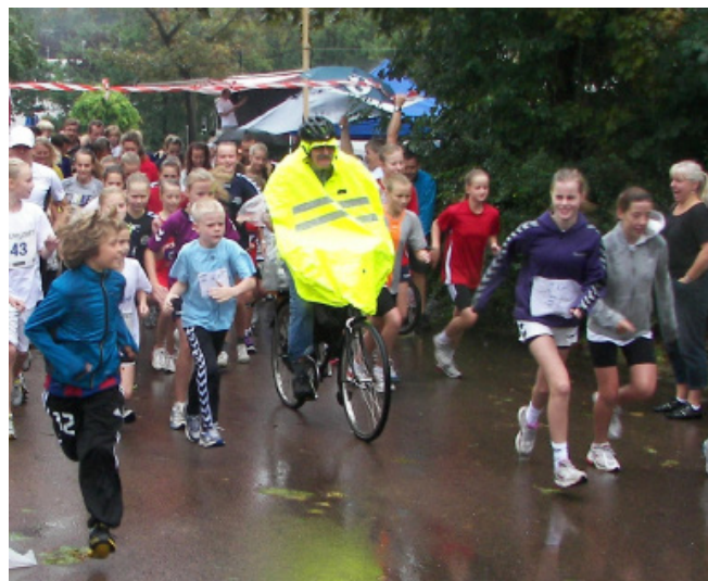
Her er Trafikaage fanget da han kørte forrest som vejviser for Virumløbet, tilbage i 2011.

Aage vil givetvis blive savnet, da han for mange altid har været der både når skolepatruljerne skulle oplæres og når de små elever skulle lære at begå sig som cyklister og fodgængere.