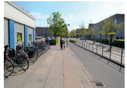
Borgerne inviteres til møde om Virums fremtid s. 13