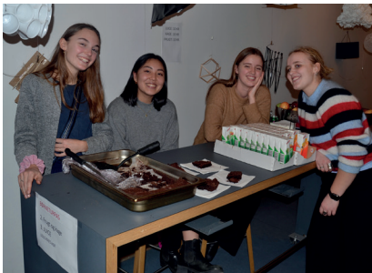
Danmarksindsamling på Virum Gymnasium s. 7

1. FEBRUAR / 2019 - 2. NUMMER - 2. ÅRGANG