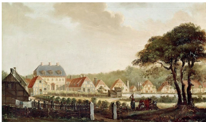
Maleri fra 1798 af Brede Værk med fabriksbygninger mod mølledammen og den nyopførte hovedbygning. Boberg

Brede Værk, der bla.a. tidligere var klædefabrik, og har haft spændende udstillinger om industrisamfundet, arbejdsliv og hverdagsliv, er i øvrigt permanent lukket siden 21. oktober, oplyser Nationalmuseet pr. telefon d. 23. januar 2019.