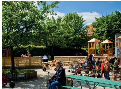
Eventyret om Peter og Den grønne legeplads s. 8 og 9