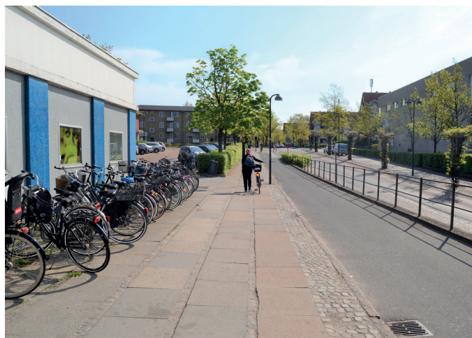
den gamle posthusgrund